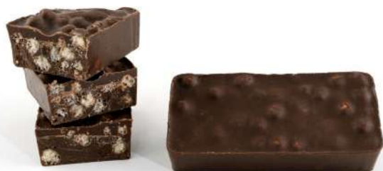
CHOCOLATE NEGRO CRUJIENTE