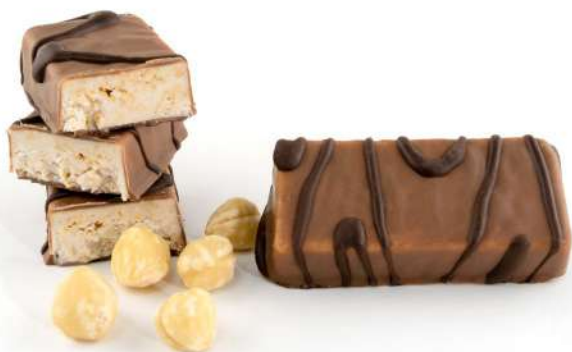
CHOCOLATE CON LECHE Y AVELLANAS