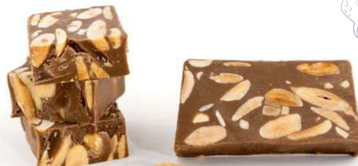
CHOCOLATE CON LECHE Y ALMENDRAS