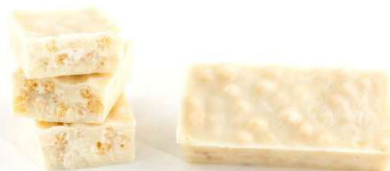
CHOCOLATE BLANCO CRUJIENTE